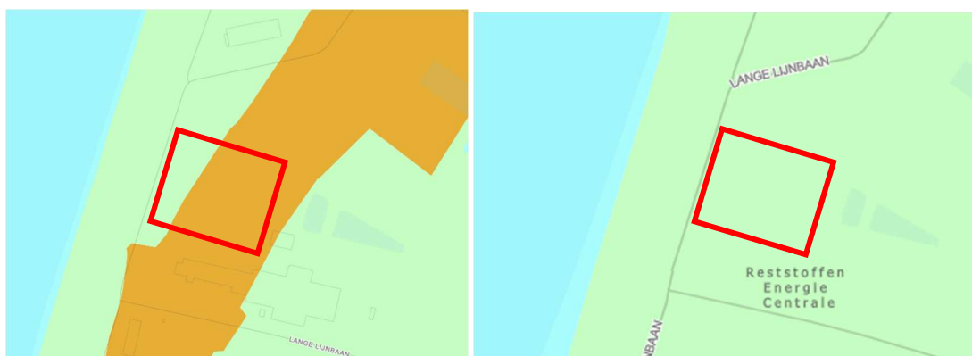
Figuur 3.3 Ligging projectgebied (rood kader) ten opzichte van archeologische waarden IJzertijd-middeleeuwen - Steentijd-bronstijd

Conform de Friese Archeologische Monumentenkaart Extra (FAMKE) ligt het projectgebied voor de periode Steentijd - Bronstijd in de zone geen onderzoek noodzakelijk . Voor de periode IJzertijd - Middeleeuwen geldt voor het oranje deel van het terrein in figuur 3.3 karterend onderzoek 1 (middeleeuwen) . Binnen deze zone wordt geadviseerd om bij ingrepen van meer dan 500 m 2 een karterend (boor)onderzoek uit te laten voeren.