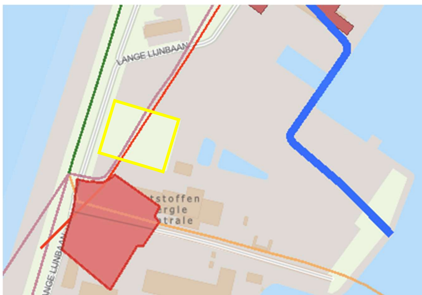
Figuur 3.2 Ligging projectgebied (geel kader) ten opzichte van cultuurhistorische waarden

De locatie kent een historie met middeleeuwse zeedijken, nabij de Gerbranda saete. Door de ontwikkelingen in de tussenliggende tijd zijn deze objecten niet meer aanwezig en worden negatieve gevolgen op cultuurhistorie, als gevolg van DDI, uitgesloten.