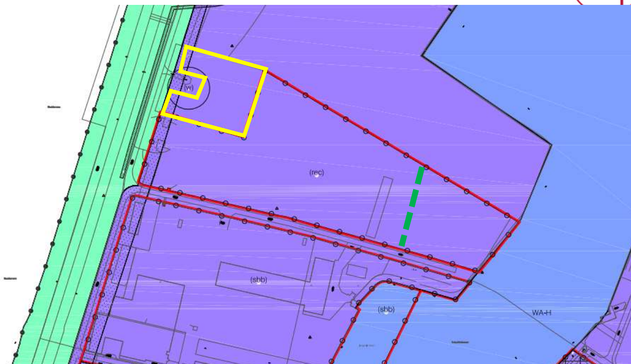
Figuur 1.2 Uitsnede plankaart (geel globale projectie DDI)

Op het bedrijventerrein zijn activiteiten tot en met categorie 4.2 uit bijlage 1 bij het bestemmingsplan toegestaan, voor zover het betreft zeehavengebonden bedrijven. Op grond van dit plan is een maximale bouwhoogte van 20 meter direct toegelaten en is een vrijstellingsbevoegdheid opgenomen tot 40 meter. De dubbel functie waterstaat geldt voor een reserveringsstrook zeewering. Hier geldt een aanlegstelsel voor uitvoering van werkzaamheden.