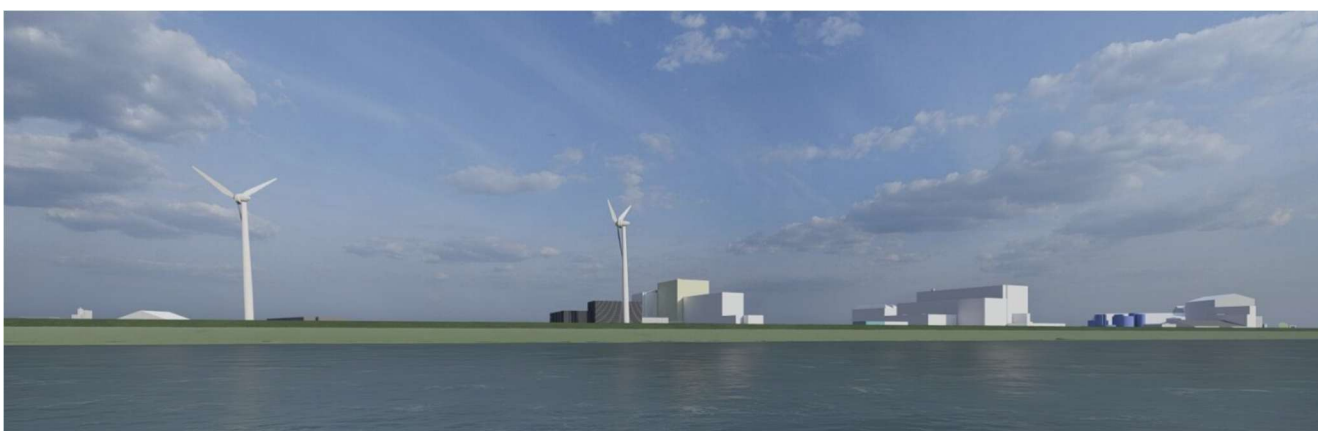
Figuur 3.1 Indicatief aanzicht op de haven vanaf de Waddenzee, DDI in donkerder kleur achter de tweede windmolen

De ontwikkeling vindt plaats op het industrieterrein Industriehaven en past binnen het industriële landschap dat daar is bestemd. De maximale bouwhoogte van DDI bedraagt 20 meter. In combinatie met het kleurgebruik zal het gebouw het aanzicht vanaf de Waddenzee niet domineren. Door de aanwezige bebouwing in de omgeving is DDI vanuit de woonomgeving niet of nauwelijks zichtbaar en zal het aanzicht op de Industriehaven zeker niet domineren.