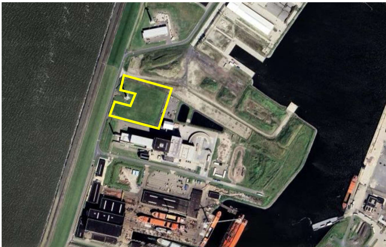
Figuur 1.1 Ligging van het projectgebied, geel globale locatie DDI

De voorgenomen ontwikkeling vindt plaats op het bedrijventerrein Industriehaven, ten noorden van de stad Harlingen. De locatie bevindt zich globaal tussen de Industriehaven en de Waddenzee en betreft perceel Harlingen (HLG02) F 1956. Dit betreft het kavel gelegen aan de Lange Lijnbaan, ten oosten van de windmolen T1 van windpark Windpowercenter en ten noorden van de Reststoffen Energie Centrale (REC).